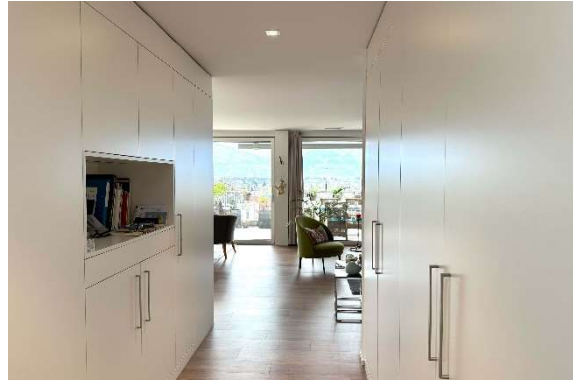
Gang mit Einbauschränken