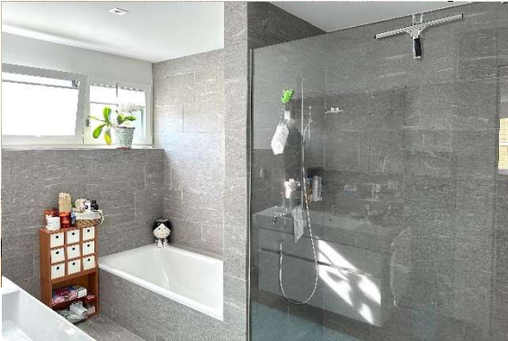
Bad, Dusche, WC