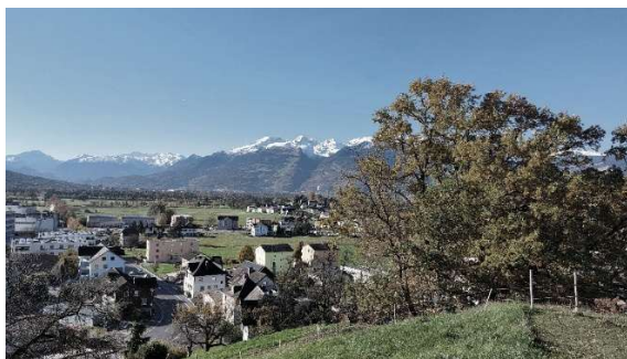
1 BLICK RICHTUNG SÜDENWEST