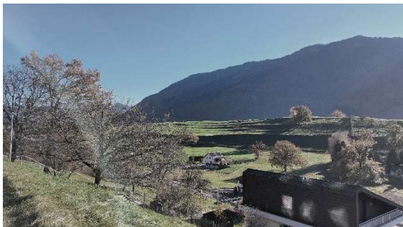
2 BLICK RICHTUNG OSTEN