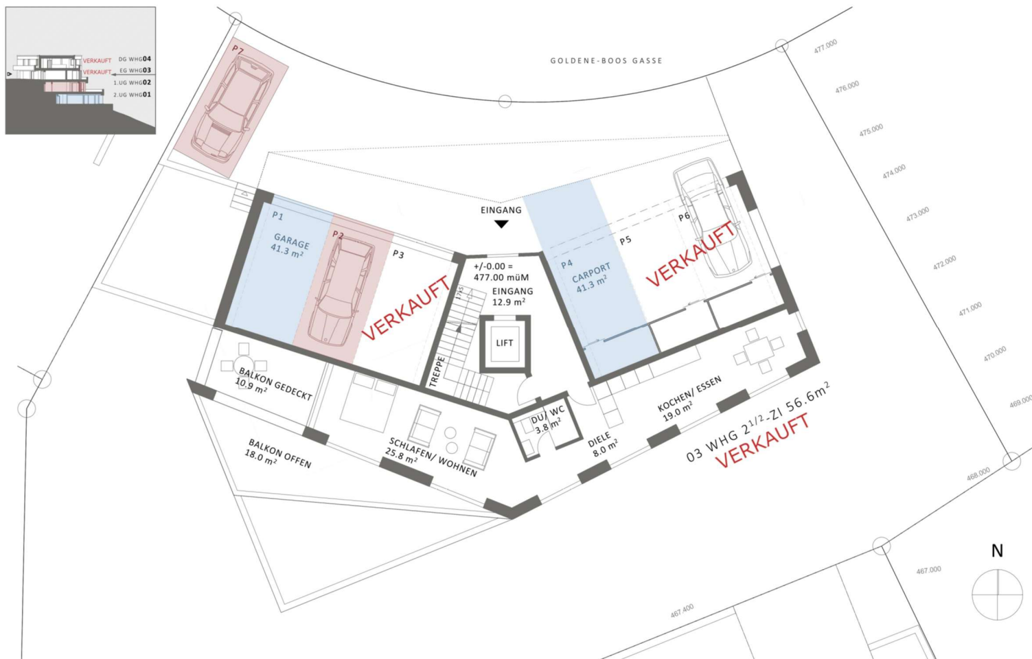
MUSTERGRUNDRISS ERDGESCHOSS WOHNUNG 3 BEREITS VERKAUFT