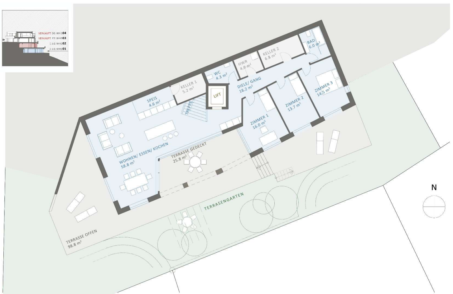
MUSTERGRUNDRISS WOHNUNG 1 IM 2. UTERGESCHOSS