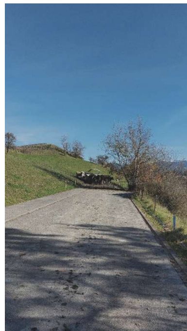
3 BLICK RICHTUNG SACKGASSE